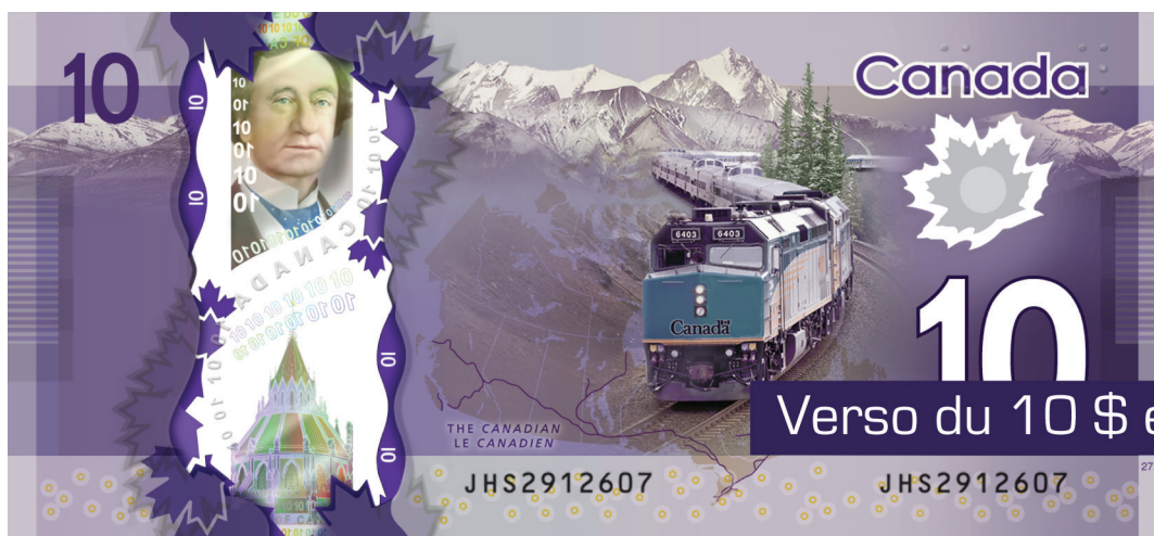
Verso du 10 $ en polymère