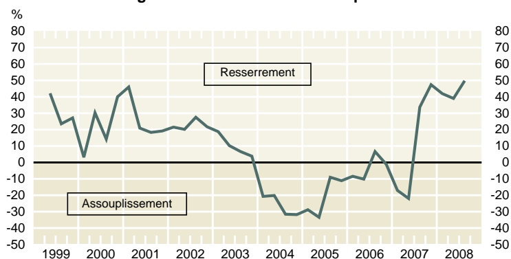
Graphique 1 Solde des opinions concernant les conditions générales du crédit aux entreprises*

* Le solde des opinions est égal à la différence entre le pourcentage pondéré des opinions des institutions financières allant dans le sens d'un resserrement et le pourcentage pondéré de celles qui inclinent vers un assouplissement. Un solde positif implique donc un resserrement net des conditions du crédit. Le graphique présente la moyenne du solde des opinions concernant les aspects tarifaire et non tarifaire des conditions du crédit.