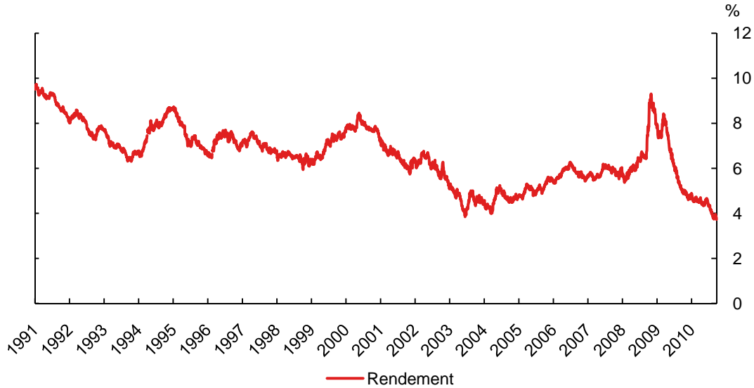
Rendement des titres de sociétés américaines de bonne qualité